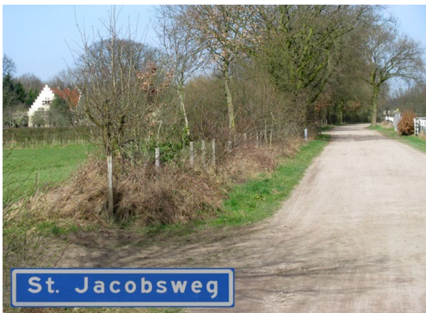
Malden, St. Jacobsweg