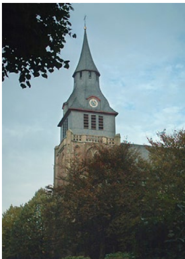
Zyfflich, Sankt Martinskirche, kern van dit gebouw was van 1436 tot 1802 abdijkerk van het Sint Martinusklooster

De verspreiding van het christendom kreeg hier een krachtige impuls met de komst van nieuwe monniken. Mogelijk werd al in 727 door de benedictijnen van de abdij van Keizersweerd bij Düsseldorf een boerenbedrijf begonnen in Overasselt. Later, maar vóór 876, is dat overgenomen door de Noord-Franse abdij Saint-Valéry-sur-Somme (gesticht door St. Valéry of St. Walrick, 550-620), die er een priorij bij vestigde. De monniken van dit klooster kerstenden de bevolking en bouwden houten kapelletjes in Overasselt en Heumen. Later, rond 1100, werden die gebouwen vervangen door zaalkerkjes in tufsteen, in de romaanse stijl die toen gangbaar was. Vervolgens werden de kapelletjes tot parochiekerk verheven. In Overasselt zijn de funderingsresten van het romaanse kerkje nog te vinden op de begraafplaats van de Nederlands-Hervormde Kerk. In Heumen heeft men op de plaats van de huidige Nederlands-Hervormde Kerk resten van de oudere zaalkerk kunnen vaststellen. Terwijl de oorspronkelijke bewoning van de regio vooral bestond uit lintbebouwing langs de oude verbindingswegen met Nijmegen, Mook, Hatert en Wijchen, ontstonden er met de bouw van de kerken ook dorpskernen.