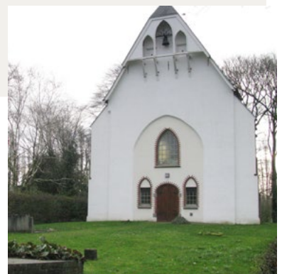
Overasselt, Nederlands-Hervormde Kerk

Kloosters bleven in de Middeleeuwen en later een rol spelen in onze dorpen. Boerderij de Munnikhof te Worsum was eigendom van het klooster van de cisterciënzerinnen in Graefenthal bij Goch (D). Boerderij de Poel viel onder de benedictijner priorij van Overasselt. Vanuit die boerderij werden de bezittingen bestuurd en de opbrengsten verzameld. In Malden, waar het kleingrondbezit overheerste, bevond zich boerderij de Munnikenhof die eigendom was van het kruisherenklooster in Sint Agatha. Ook het Martinusklooster in Zyfflich, het klooster Graefenthal bij Goch, het Regulierenklooster te Nijmegen en de Zusters van de Hessenberg bezaten in bepaalde periodes in Malden grond en boerderijen. Het Agnietenklooster op de Teersdijk was een tijdlang in bezit van de Bagijnenhoff in Heumen.