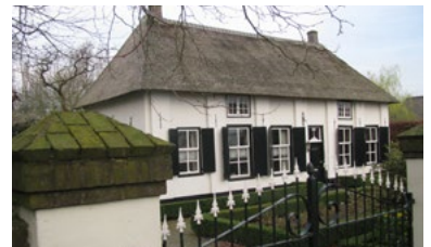
Heumen, Bagijnenhoff, vroegere pachthoeve van zusterklooster Sint Agnieten uit Nijmegen