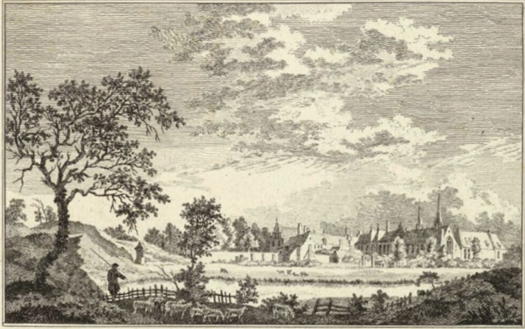
Het Klooster genaamt NIEUWKLOOSTER aan de Niers 1744.