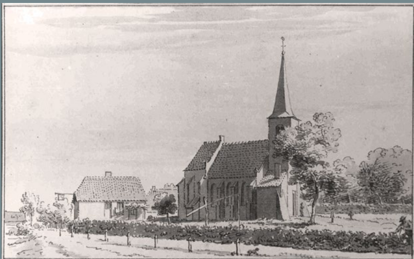
Cornelis Pronk del. 1732.