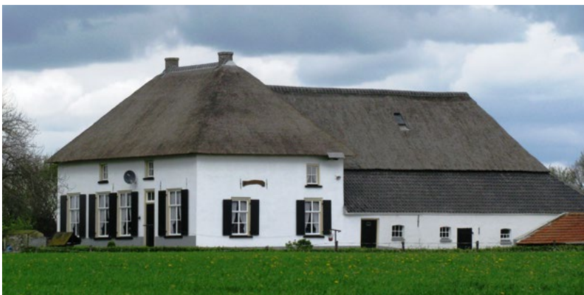
Overasselt, de Munnikhof