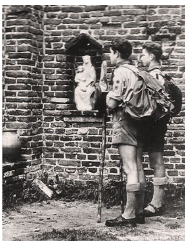
De verkenners bij de madonna van Sint-Walrick, ca. 1953

In de zestiende eeuw, met de komst van de reformatie, verloor de kapel haar functie en raakte in verval. In de achttiende eeuw restte er nog slechts een forse ruïne. In de twintigste eeuw waren er plannen voor restauratie, maar door de Tweede Wereldoorlog kwam daar niets van. Na de oorlog is de kapel deels weer opgemetseld met oude stenen van het voormalige kasteel van Balgoij.