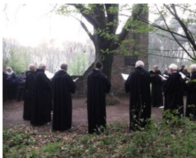
Schola Karolus Magnus in 2014 bij Sint-Walrick

De volksdevotie rond de ruïne is nooit verdwenen. Tot vorige eeuw werden er in de vastentijd, met tweede Paasdag en Pinksteren pelgrimstochten georganiseerd naar de ruïne en de ernaast staande lapjesboom. Nog steeds hangen daar honderden lapjes. Of er wonderen hebben plaatsgevonden weten we niet. De koortsboom en de pittoreske ruïne hebben hun geheimen nooit geheel prijsgegeven.