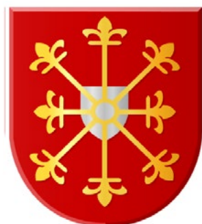
Wapen graafschap Kleef (afb. nl.wikipedia.org)

De burcht wordt voor het eerst vermeld in een stuk uit 1300, maar waarschijnlijk werd zij omstreeks 1270 al gebouwd door de graaf van Kleef. Nadat in 1301 Diederik Korte Loef door de graaf van Kleef tot rentmeester van Malden was benoemd, verplichtte die zich om de van oorsprong houten Malderburch om te bouwen tot een stenen burcht, zodat Kleef een versterkt huis bezat bij zijn grens met Brabant. Kleef steunde in die tijd het graafschap Gelre in de aanhoudende strijd met het hertogdom Brabant.