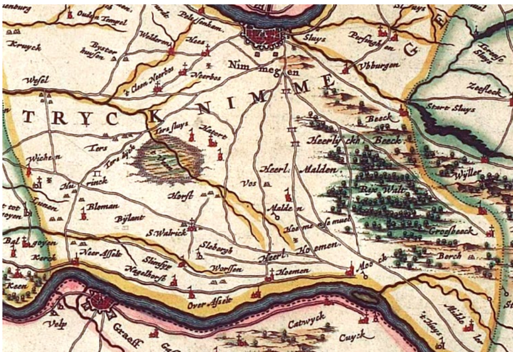
Tetrarchia ducatus Gelriae Neomagensis, Het Rijk van Nijmegen, met apart aangegeven Malden en de Heerlijkheid Malden, evenals Heumen en de Heerlijkheid Heumen, 17e eeuwse kaart (afb. Bibl. Nat. de France)