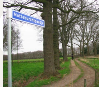
Malden, Motteburchtpaadje, genoemd naar de vroegere burcht

De Maldense burcht lag aan een watergang, de Leigraaf, die voor de ontwatering van het broekland zorgde en tevens de grachten van de burcht van water voorzag. Deze Leigraaf vormde deels de grens tussen de heerlijkheden Malden en Heumen. De Malderburch was een motteburcht, een type dat vrij algemeen was in de Middeleeuwen. Die werd in de regel gebouwd op een kunstmatig opgeworpen heuvel, in het Frans aangeduid met 'motte'. Het complex bestond uit een burcht en een voorburcht. De burcht was aanvankelijk gebouwd als een houten versterking met palissaden, grachten en wallen, die later werd omgebouwd tot een stenen versterking van baksteen en tufsteen met kalkmortel. De burchtheuvel had een middellijn van bijna 30 meter. Het cirkelvormige terrein was omgeven door een wal en een buiten- en binnengracht. In de buitenste gracht heeft nog jaren later water gestaan.