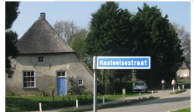
Overasselt, Kasteelsestraat (foto LE)

Behalve het kasteel van Heumen en de motteburch van Malden kende onze gemeente nog verschillende andere gebouwen met allure. In Overasselt lagen volgens de oude leenaktenboeken van het Kwartier van Nijmegen drie adellijke bezittingen. Allereerst is er Het Huys te Overasselt, ook wel kasteel genoemd, dat waarschijnlijk ten oosten van het oude Nederlands-Hervormde kerkje lag. Het sneuvelde in de Hollands-Franse oorlog (1672-1678), toen Franse legers langs de Maas optrekkend Nederland binnenvielen en veel verwoesting aanrichtten in de regio. Tot de bezittingen van dit huis behoorden drie bouwhoven: het Duyfhuys (aan de Schoonenburgsestraat), de Bakelaar (aan het begin van de Garstkampseweg bij de Hoogstraat, thans verdwenen) en de Meulenbergh (aan de Oude Kleefsebaan).