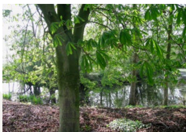
Overasselt, gracht van vroegere havezathe Sleeburg