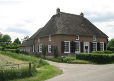
Lage Hoed, Nederasselt