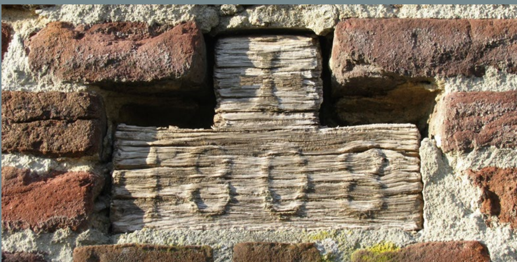
Malden, Munnikenhof, jaartal 1808 en wapen van de kruisheren, aangebracht boven ingang 'bakhuis'