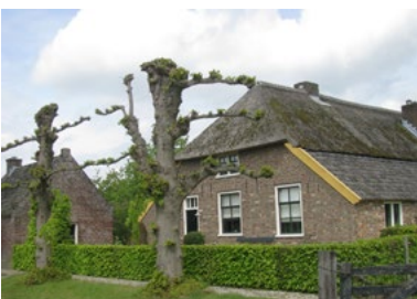
Malden, Munnikenhof met links het 'bakhuis'