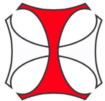
Wapen van de kruisheren van Sint Agatha