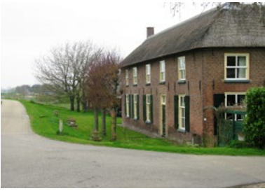
Den Tempel, Overasselt