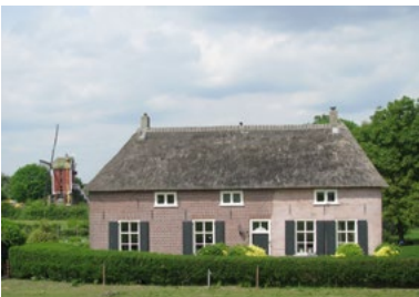
Molenaarshuis, Nederasselt