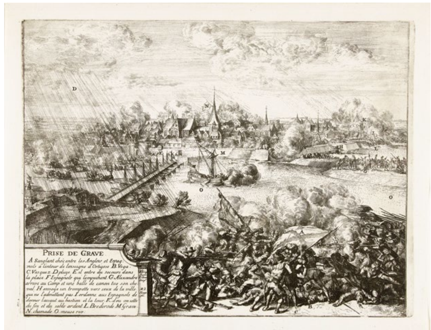
Romeyn de Hooghe, De Inname van Grave, belegering door Parma, gezien vanaf de Nederasseltse kant, 1586, ets (Rijksmuseum, Amsterdam, RP-P-OB-80.024)