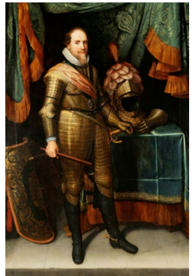
Michiel Jansz. van Mierevelt, portret van Maurits, prins van Oranje, ca. 1613 - ca. 1620 (Rijksmuseum, Amsterdam)