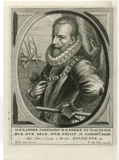
Pieter de Jode, naar Otto van Veen, portret van de hertog van Parma (Rijksprentenkabinet, Amsterdam, RP-P-OB-9032)

Aan het einde van de eeuw stond Europa in vuur en vlam en ook dat had zijn weerslag in deze regio. In 1789 vond de Franse Revolutie plaats en begon een serie Europese oorlogen, waar ook ons land bij betrokken was. In 1794 trok een Frans leger van meer dan 100.000 man op tegen de Republiek en sloeg het beleg voor Grave. Voor de zoveelste keer werd de regio geteisterd door soldatenvolk. Er kwam een einde aan de Republiek der Verenigde Nederlanden en de Bataafsche Republiek werd gesticht. Bestuurlijke structuren en privileges die aan de oude standenmaatschappij herinnerden, moesten wijken. Vandaar dat in 1798 de heerlijkheden Heumen en Malden werden opgeheven. Zij kregen nu de bestuursvorm van een gemeente.