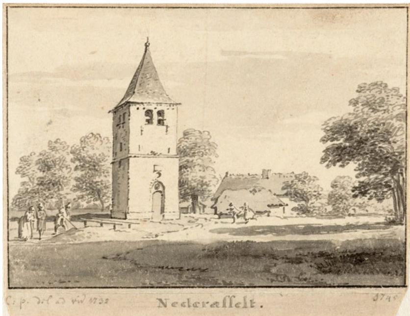
Cornelis Pronk, Kerkjes van Overasselt en Nederasselt, tekeningen, 1732 (Rijksmuseum, Amsterdam, RP-T-1921-18 en RP-T-1900-A-4390)