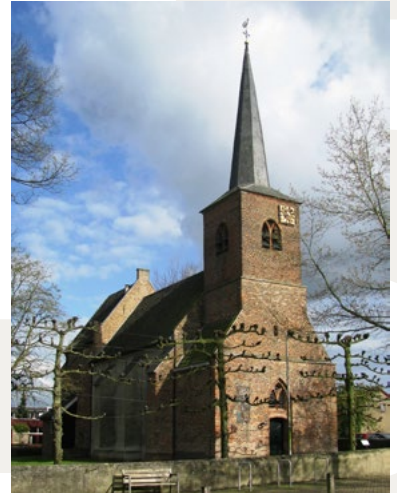
Heumen, Nederlands-Hervormde Kerk