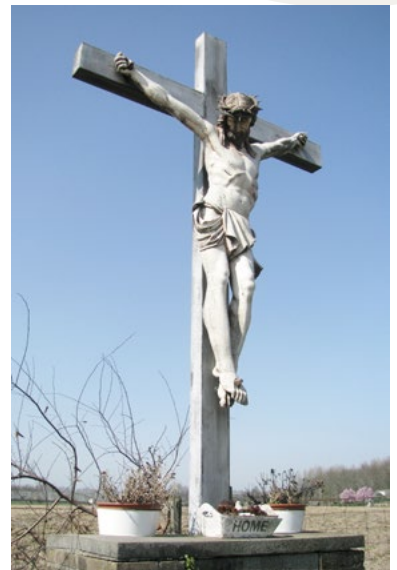
Kruisbeeld, Rotsestraat, Overasselt, op plaats van vroegere schuurkerk