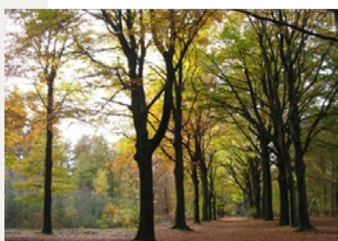
Laan in Heumensoord, 2006