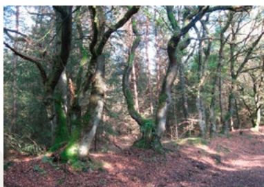
De wal van 1778