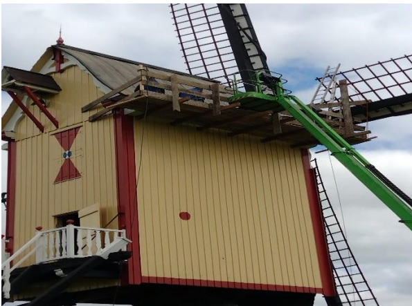
De schaliën op het dak worden vernieuwd

Omdat we de afgelopen jaren fors arbeid verricht hebben om het onderhoud op orde te krijgen, was het dit jaar een rustig jaar. De Molenmaker was in 2022 belast met het fabriceren van de benodigde schaliën, de dak-bedekking voor het dak van het bovenhuis. De schaliën zaten er al meer dan 40 jaar op en waren door de weersinvloeden slecht geworden en waaiden bij harde wind er af. Hierdoor was het risico op lekkage groot en heeft de schaliën in 2023 vervangen.