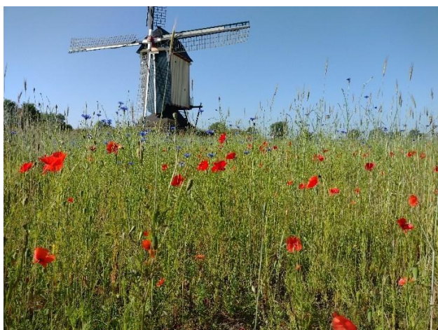
Kleuren pracht van bloemen op de akkers bij de molen

In de akkers die bij de molen horen, is een uniek oude graansoort aangetroffen: