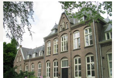
Nederasselt, Joannesklooster

De eerste zusters die zich hier vestigden waren die van de Sociëteit van Jezus, Maria, Jozef (JM.J). Zij kwamen op initiatief van het kerkbestuur van Nederasselt dat in 1903 aan de bisschop toestemming had gevraagd en gekregen voor de bouw van een klooster en een school. Het werd het St. Joannesklooster aan het Kerklaantje 10 in Nederasselt. Een jaar later werd de bewaarschool geopend. In 1912 werden nog een patronaat en het gasthuis toegevoegd. De zusters hebben zich verdienstelijk gemaakt voor jongens en meisjes in de bewaarschool en voor de meisjes in de lagere school en de naaischool. Op 15 juli 1990 vertrokken na 85 jaar de laatste zes zusters uit het klooster.