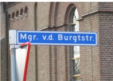
Mgr. v.d. Burgtstraat, Overasselt

In 1924 kwamen de zusters franciscanessen van Mariadal uit Roosendaal naar Malden. Op 28 april begonnen zij daar een leer-, bewaar- en naaischool voor de opvoeding van meisjes. In 1925 konden zij het klooster Jeruzalem aan de Rijksweg 135 betrekken dat naast de Mariaschool voor meisjes lag. Vanaf 1933 zetten zij zich tevens in voor de wijkverpleging en begonnen een consultatiebureau voor zuigelingenverzorging. In 1964 werd een stichting opgericht om de bouw van een bejaardencentrum aan de Broekkant te realiseren. De zusters waren bereid de verzorging van de bejaarden op zich te nemen. De gemeente kocht het klooster van de zusters. In 1968 was het verzorgingshuis gereed en werd het klooster op last van de gemeente afgebroken om plaats te maken voor een winkelcentrum dat overigens nooit op deze plaats is gekomen. Wel herinnert de Kloosterstraat aan het huis van de zusters.