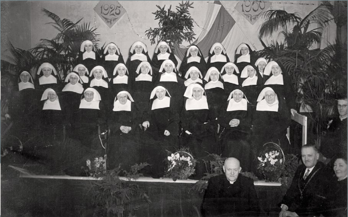
25-jarig jubileum van de zusters van klooster Jeruzalem, Malden, 1950