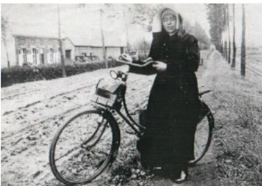
Franciscanesse te fiets, Malden