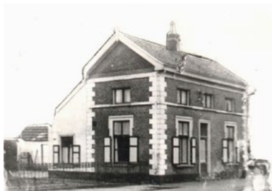
Malden, Tolhuis

De weg van noord naar zuid liep in de Romeinse tijd door Heumensoord, dus meer oostelijk. Daar getuigt de wachttoren van, waarvan de sporen in het bos zichtbaar zijn. Het is niet bekend wanneer die weg in onbruik is geraakt. Later heeft er eeuwenlang een weg gelopen van Nijmegen naar Mook, ongeveer over het pas vernieuwde fietspad door het bos. Weer later zou de huidige rijksweg worden aangelegd. Op de kaarten van Tranchot uit het begin van de negentiende eeuw en van Jacob Kuijper uit ca. 1868 staan beide wegen aangegeven.