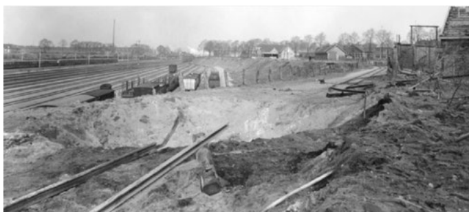
Het treinstation van Nijmegen en de lijn van de MBS na het bombardement van februari 1944