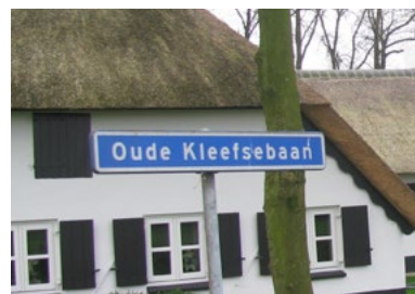
Oude Kleefsebaan, Overasselt

In de jaren tachtig van de twintigste eeuw werd de A73 aangelegd, de snelweg van Nijmegen naar Venlo. Voor onze gemeente betekende het een betere verbinding met het zuiden en westen des lands, maar helaas sneed deze weg het landschap wel doormidden.