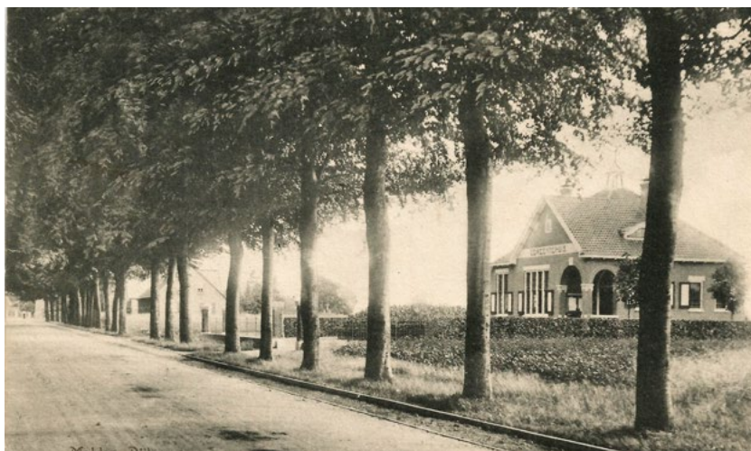
Rijksweg in Malden, met tramrails, kaart verstuurd 1925