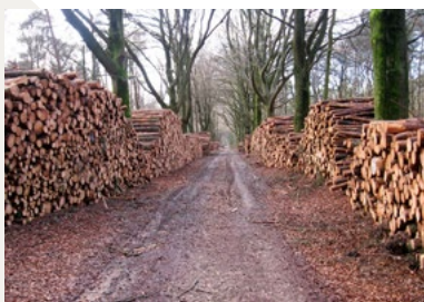
Houtproductie in het Heumensoord

Zo tussen 1925 en 1935 speelde het Heumensoord een belangrijke rol in de werkverschaffing, vooral voor Nijmeegse werklozen. Er waren toen dagen dat er meer dan 600 mannen bezig waren om het Oord brandveiliger te maken, met name langs de spoorlijnen. In 1928 en 1929 is als werkverschaffingsproject en ter voorbereiding van allerlei andere plannen ook de diepe kuil gegraven vlak bij de restanten van de wachttorens. Het grondwater bleek er erg diep te zitten, in elk geval zo diep dat het niet mogelijk bleek op deze manier drinkplaatsen voor de vogels te maken.