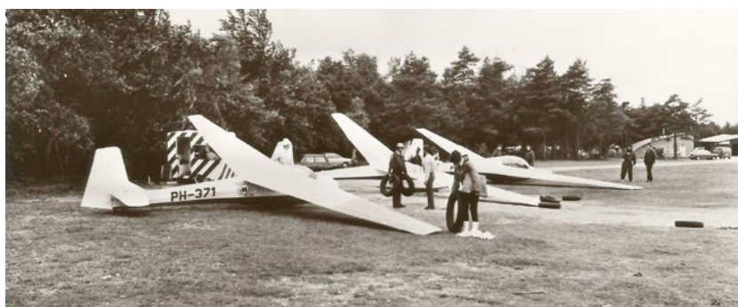
Malden, Zweefvliegveld in 1977

Tussen de Bosweg en de Maldense bebouwing is een flink stuk grond als Heemtuin ingericht. Enthousiaste vrijwilligers zorgen ervoor dat de schooljeugd en andere geïnteresseerden bijvoorbeeld kunnen zien welke gewassen er vroeger verbouwd werden en hoe die werden geoogst en gebruikt. Ook is er een insectenhotel ingericht en een stukje van een beplante veekering nagebootst.