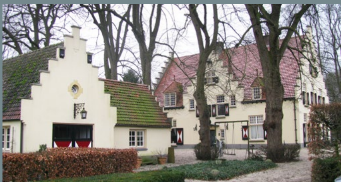
Villa Grootstal, Malden