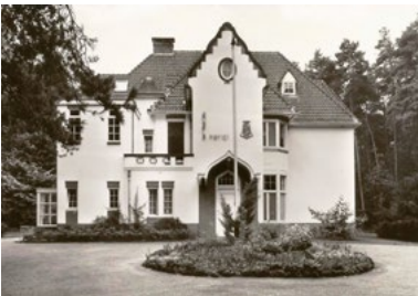
Villa Klein Heumen

Villa Grootstal, met zijn karakteristieke trapgevel, is van tamelijk recente datum, maar kan bogen op een veel langere historie. Al in de vijftiende eeuw bevond zich op deze locatie een ontginningsboerderij 'Grootte Stal' of 'Op den Stal', die een erfpachtgoed was van het Nijmeegse burgergeslacht Van Weelderen en van 1463 tot in het begin van de 16e eeuw eigendom was van de kruisheren van Sint Agatha. Het huidige landhuis is in 1914–1915 gebouwd, in opdracht van het echtpaar De Bruijn-van Roggen. Het werd echter al in 1917 verkocht aan mr. M.C.T.M. baron van Hövell tot Westerflier (1887–1956) die de buitenplaats transformeerde tot een landgoed. Inmiddels spannen de derde en vierde generaties Van Hövell tot Westerflier zich in om op innovatieve wijze, met onder meer duurzaam bodemgebruik, het landgoed in stand te houden. Grootstal vormt daarmee een boeiende schakel tussen het stedelijk gebied van Nijmegen en zijn agrarische omgeving en is een Point of interest binnen het kader van Nijmegen Green Capital 2018.