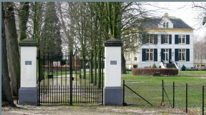
Villa Elshof, Malden

Het oudste buithuis is de Elshof dat voor het eerst als landgoed wordt vermeld in 1776, maar ongetwijfeld veel ouder is. In 1864 werd daar een grote statige villa gebouwd door de Nijmeegse advocaat Reinier van Harencarspel (1852-1901). Als mogelijke architect wordt Pieter van der Kemp genoemd. Die ontwierp een jaar later, in 1865, een vergelijkbaar buithuis, het Chalet Brakkenstein. Bij het buithuis is ook een Engelse tuin aangelegd, met grot, bergje, tempeltje en andere tuinsieraden. Tegenover het huis werd een koetshuis gebouwd. In de twintigste eeuw is het pand van 1942 tot 1944 bewoond geweest door de paters augustijnen, vervolgens door Duitse, Canadese en Engelse soldaten. Van 1950 tot 1963 was het bezit van de gemeente Heumen, die het verhuurde aan mevrouw Van der Kallen die er een kindertehuis in vestigde. Sinds 1993 echter heeft het zijn functie als particulier buithuis weer teruggekregen.