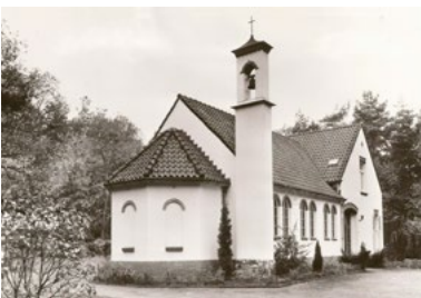
Villa Klein Heumen, kapel