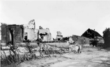
Huis van Johan Welles te Overasselt, in nacht 7-8 augustus 1941 getroffen door neergestort Engels vliegtuig

Sommige gezinnen kregen inkwartiering van Duitse soldaten. Andere mensen hadden onderduikers in huis en waren actief in het verzet. Luisteren naar radio Oranje was streng verboden. Er was ook steeds gevaar vanuit de lucht. Zo stortte er in 1941 een Engels vliegtuig neer in Overasselt en in 1943 een bij de brug van Heumen. Alleen de mensen die lid waren van de Nationaal Socialistische Beweging (NSB) hadden het iets makkelijker. In onze gemeente waren dat voornamelijk zogenaamde 'brood-NSB-ers' die voor werk en boterham lid waren geworden van de NSB.