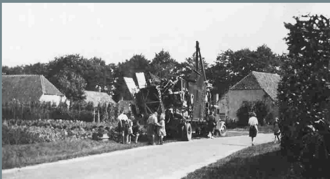
Engels vliegtuig in 1941 neergeschoten ten oosten van kanaal bij Heumen; resten afgevoerd

In de loop van de bezettingstijd veranderde er voor iedereen van alles. Het gemeentehuis werd op 10 mei 's morgens om zeven uur al gevorderd. De afdelingen van de R.K. Boerenbond en de Werkliedenvereniging werden in 1941 opgeheven. Vervoer werd beperkt. Om het Maas-Waalkanaal over te steken had men een pasje nodig. De Heumense beeldhouwer Maris bijvoorbeeld moest speciale toestemming vragen om voor lopende projecten elders in het land de auto te gebruiken. Alle personen van 15 jaar of ouder moesten een legitimatiebewijs, het persoonsbewijs, bij zich hebben. Artikelen zoals steenkool, boter, vlees en meel waren schaars en alleen op de bon verkrijgbaar of via de zwarte handel die bloeide. De boeren bleven normaal doorwerken, maar ze moesten eieren, varkens, koeien, melk en paarden aan de Duitsers leveren. Met wat ze over hadden, konden ze heimelijk handel drijven. Zo zijn er weken geweest dat er bij de sluis en de betonfabriek in het Maas-Waalkanaal schepen kwamen uit Zuid-Limburg, waar men etenswaren zoals vlees en boter kon ruilen tegen kolen. De fietsen hadden linnen banden die men slechts kon krijgen tegen bonnen. Huizen moesten na acht uur 's avonds verduisterd worden. De mensen gingen vroeg naar bed want er was spertijd en dat betekende dat je na acht uur 's avonds niet meer op straat mocht komen.