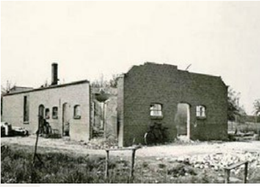
Huis van de familie Kesslerer te Heumen afgebrand