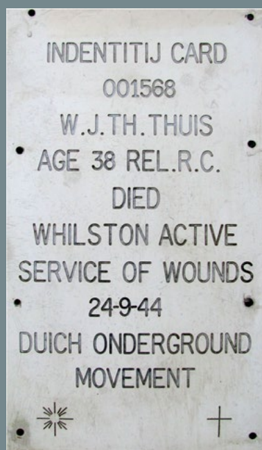
Herdenkingsplaquette op het graf van Wiro Thuis