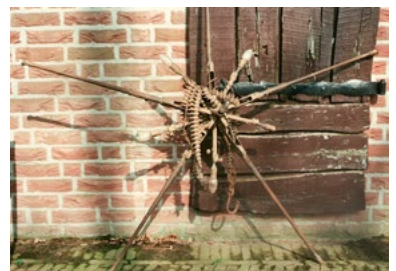
Luchter, door Maris gemaakt met geweren uit de oorlog, hing jarenlang in zijn atelier (Ateliërmuseum Jac Maris)