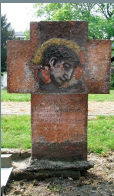
Graf voor Wiro Thuis, gemaakt door Jac Maris, Malden, R.K. Kerkhof