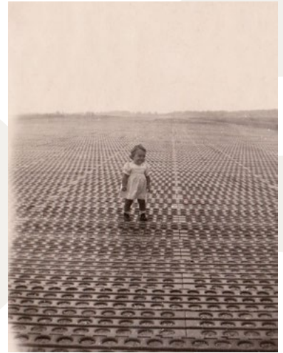
De PSP-platen van het vliegveld

Op 1 maart 1945 is de 24e Airfield Construction Group begonnen met de bouw van wat Airstrip B91 werd gedoopt. Er moesten 13 huizen worden afgebroken en van de molen (gelegen in de huidige Molenwijk), die in de aanvliegroute lag, werden de wieken verwijderd. De baan werd ca. 1400 meter lang en 40 meter breed en bestreek een oppervlakte van 160 hectare. Parallel aan de baan liepen taxi- en autobanen, langs de bosrand konden de vliegtuigen worden gestationeerd. Het vliegveld was op 17 maart 1945 gereed en op 21 maart kwamen de eerste squadrons met Typhoon- en Tempestvliegtuigen aan, die als taak hadden het Duits afweergeschut uit te schakelen. Later zouden er ook Glosterstraaljagers opstijgen. Het vliegveld is slechts een maand door gevechtsvliegtuigen gebruikt, tot 20 april 1945. Daarna heeft het alleen nog gediend voor het vervoer van gewonde soldaten naar Engeland en Duitsland.