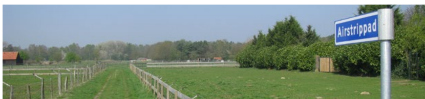
Vliegveld Airstrip B91

Er is in Malden nog maar weinig dat herinnert aan vliegstrip B91. Van de barakken, greppels, kuilen en kelders, rolbanen, betonmatten, staalplaten en omheiningen is vrijwel niets meer zichtbaar in het huidige landschap. Wel zijn in de bosrand delen van de omheining en enkele rolbanen opgenomen in de structuur van de bospaden en er zouden zich in de bodem van het vroegere vliegveld nog veel resten uit WO II bevinden. Verder kan men op enkele plaatsen bij boerderijen aan de Hatertseweg in Malden nog de geperforeerde staalplaten (PSP) zien die nu als afrastering worden gebruikt. Het terrein van het voormalige vliegveld is later deels gekocht door sportvereniging Union en deels weer weiland geworden. Een veldweg daar is onlangs omgedoopt tot Airstrippad.