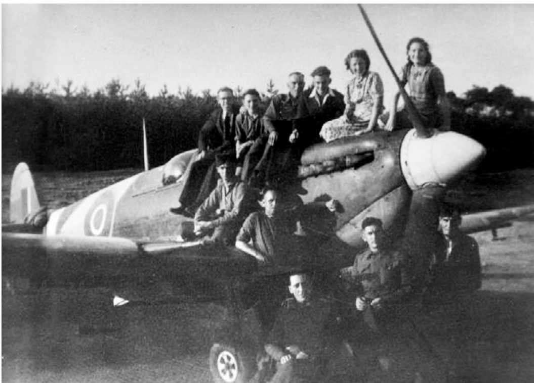
Malden, een Spitfire op het vliegveld Airstrip B91