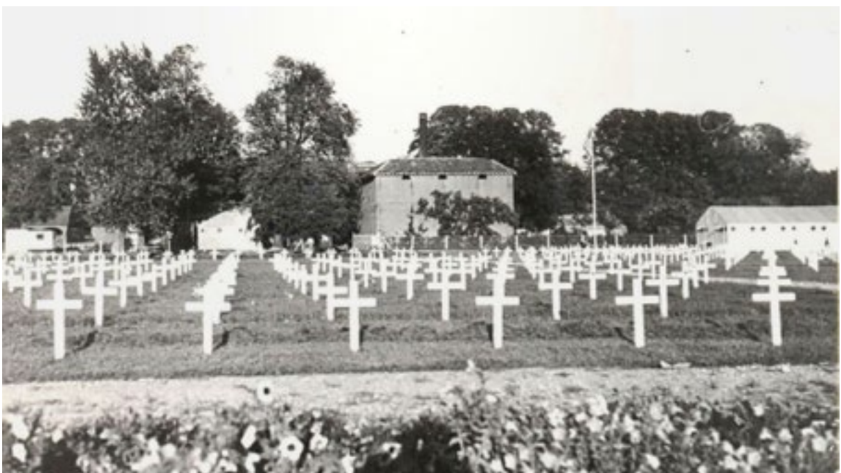
Voormalig Amerikaans-Britse oorlogskerkhof, Heumen-Molenhoek, 1944-1948