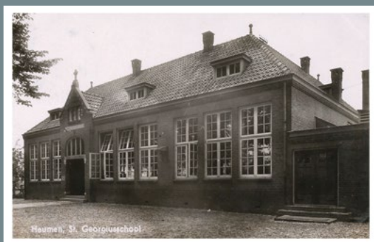
St. Georgiusschool, Heumen

De eerste school met bijzonder (katholiek) onderwijs in onze gemeente werd gevestigd in Nederasselt. Daar begonnen al in december 1905 de zusters van JMJ (Jezus, Maria en Jozef) een meisjesschool, in het voor hen gebouwde St. Joannesklooster in het Kerklaantje. Tot 1962 bleef dat zo, toen is de openbare lagere school opgeheven en werd het schoolgebouw aan het kerkbestuur ter beschikking gesteld. Het onderwijs werd toen gecontinueerd met een bijzondere (katholieke) school voor jongens en meisjes.