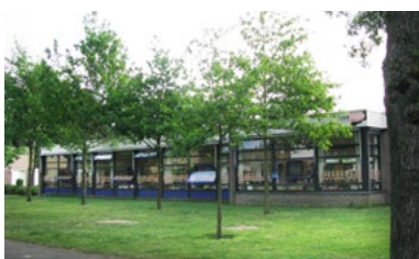
De Vuurvogel, Jenaplanschool, Molenwijk, Malden (foto LE)

In Heumen heeft in 1924 de overgang van openbaar naar bijzonder (katholiek) onderwijs plaatsgehad. De gemeenteraad besloot hiertoe op 27 maart na een verzoek van het kerkbestuur aldaar. De school werd genoemd naar Heumens patroonheilige St. Georgius, de naam is later veranderd in Basisschool St. Joris.