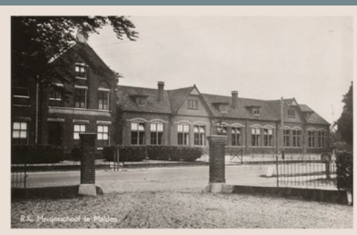
R.K. Mariaschool voor meisjes, Malden