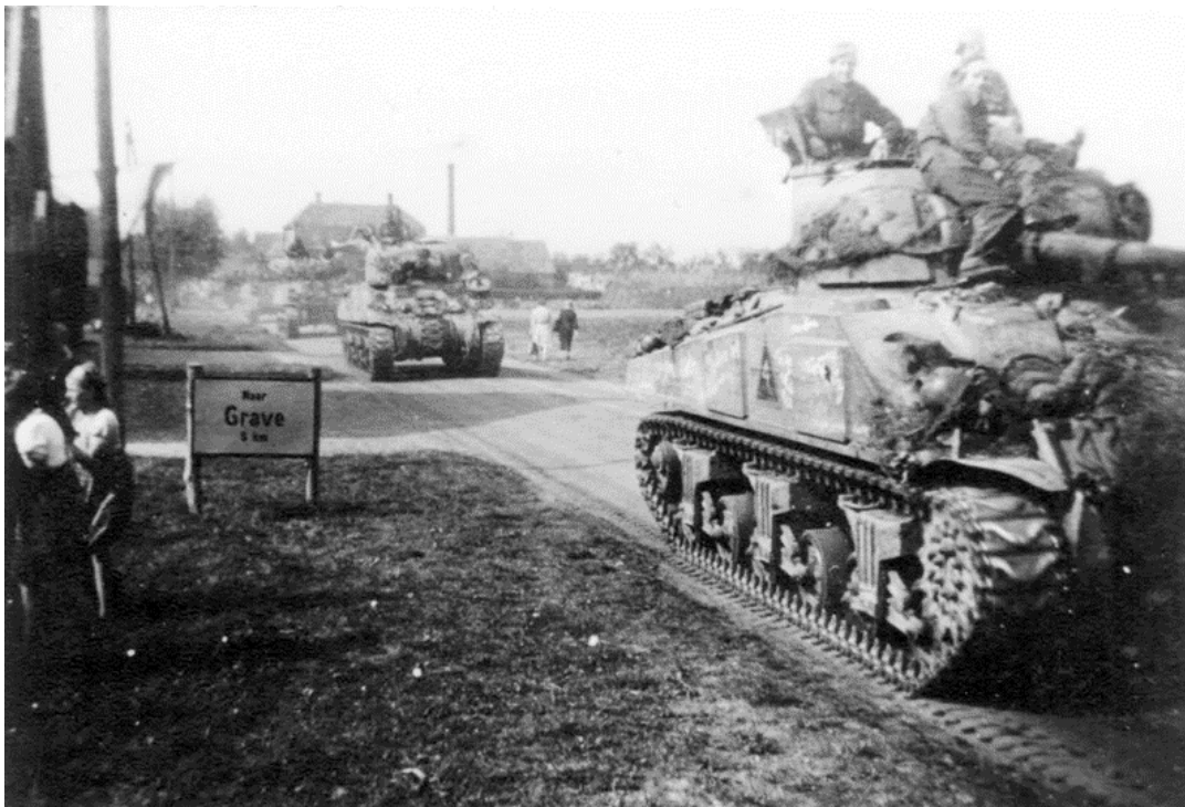
Tanks met militairen en inwoners in Overasselt, Schoonenburgseweg, september 1944

Werkgroep Beeldbank Overasselt heeft maar liefst 97 foto's van Market Garden op de beeldbank van het Erfgoedplatform geplaatst met bijbehorende toelichting. Kijk op www.erfgoedheumen.nl en de button 'Beeldbank' en vul de zoektermen 'Market Garden' of 'Tweede Wereldoorlog' in.