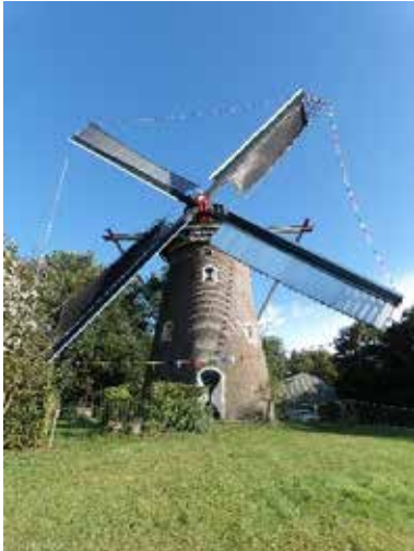
Sint Georgiusgilde, Heumen

Al meer dan 575 jaar is het Sint Georgiusgilde een begrip in het dorp Heumen.