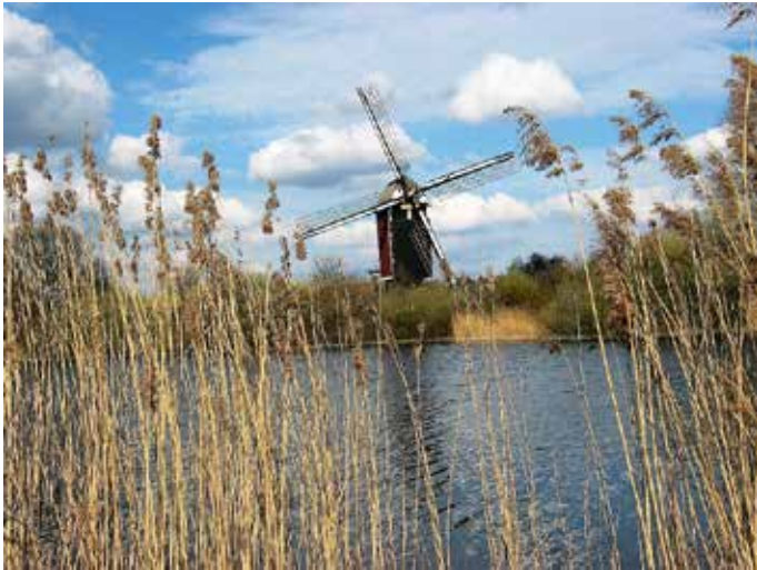
De Maasmolen, Nederasselt

De Maasmolen is een standerdmolen. Dit type molen is rond 1200, via Frankrijk, naar de Nederlanden gekomen. De hele molenkast, inclusief de wieken en de staart, rust op een 200 jaar oude eikenstam (standerd/staak), vandaar de naam standerd- of staakmolen.