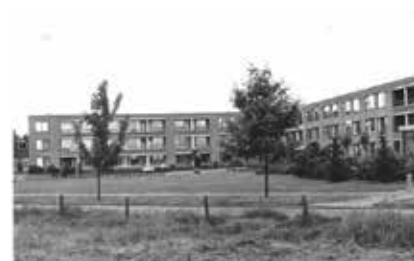
Bejaardentehuis Malderburch, 1968

Monumenten zijn historische gebouwen, archeologische vindplaatsen of door mensen aangelegde groene structuren, zoals parken. Deze worden beschermd door de rijksoverheid, provincie of gemeente vanwege hun cultuurhistorische waarde.