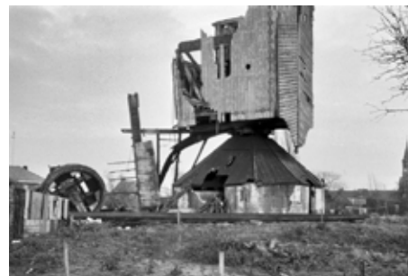
De verwoeste molen, 1972

Het is dit jaar precies 50 jaar geleden dat onze Overasseltse molen 'de Zeldenrust' in het centrum van ons dorp door een zware novemberstorm in 1972 werd verwoest en precies 40 jaar geleden in 1982 zijn plaatsvervanger feestelijk werd geopend op de nieuwe plek aan de Oude Kleefsebaan.