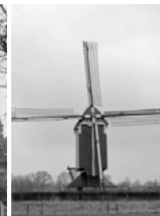
De gerestaureerde molen, 1982

Wij houden een feestelijke bijeenkomst bij de molen en een uitgebreide fototentoonstelling. Uiteraard is de molen open en te bezichtigen en geven de molenaars uitleg over dit historisch werktuig en de betekenis ervan voor Nederland.